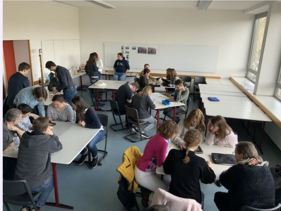
Erstes Schüler-Eltern-Lehrer-Treffen der Klasse 9a