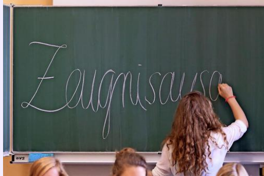
Fr, 31. Januar: Zeugnisausgabe Klassen 5-12