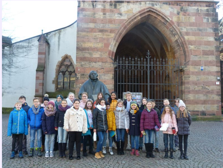
Die Klassen 6b und 6c erkunden die Landauer Stiftskirche