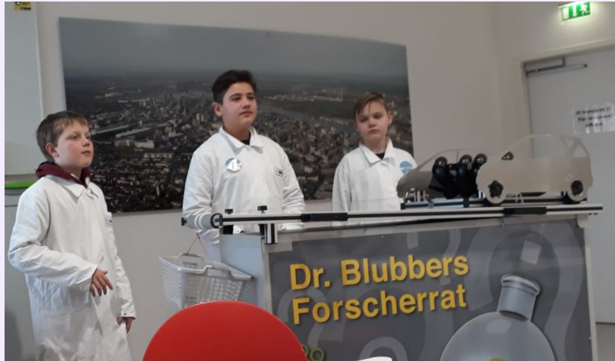
Die Jungforscher der Klasse 5b in der BASF