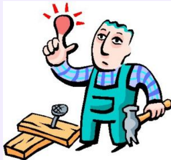
Mo, 20. Januar – Fr, 31. Januar Betriebspraktikum Klasse 11