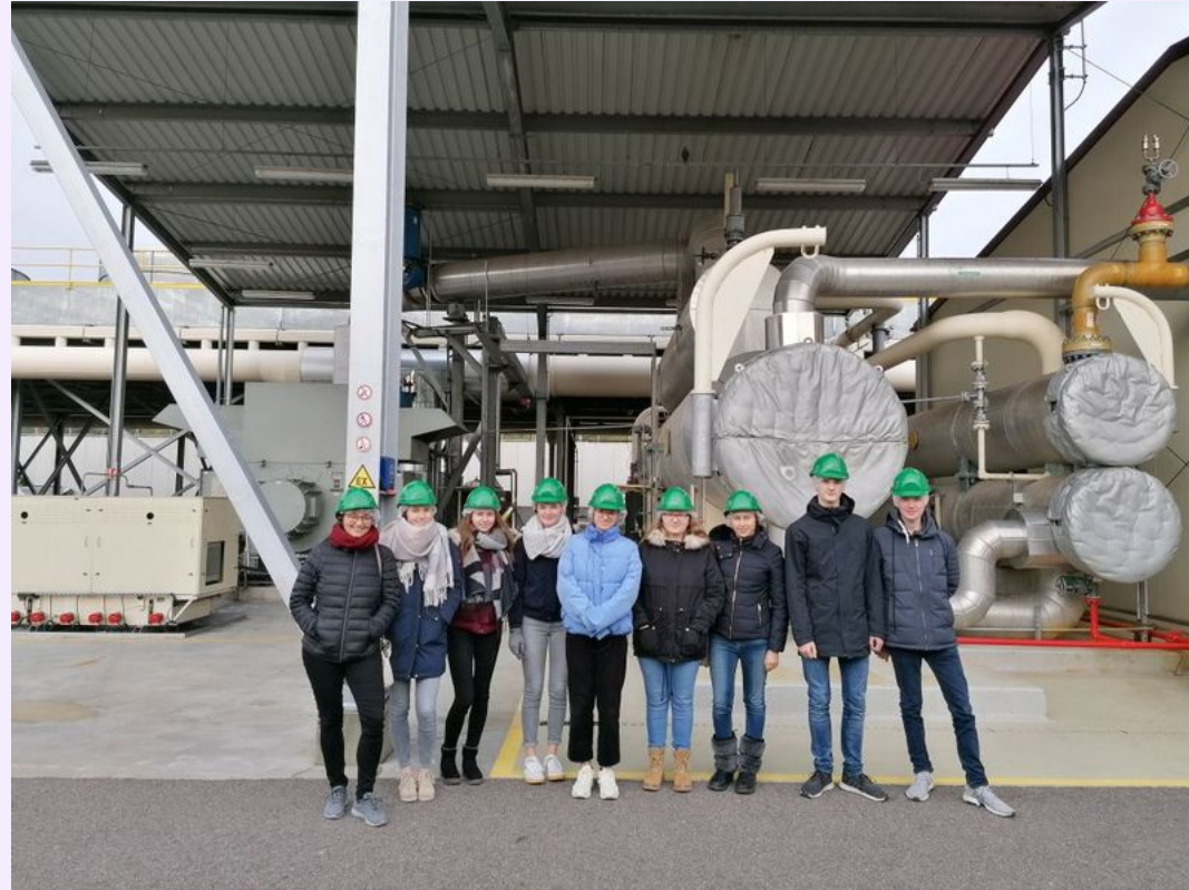
Im Geothermiewerk Insheim