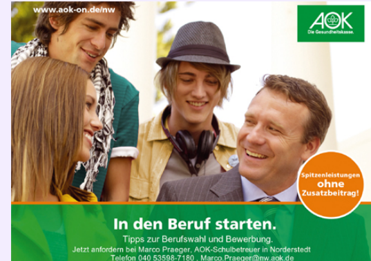
Di, 28.1. und Mi, 29.1. AOK-Bewerbertraining Klassen 9